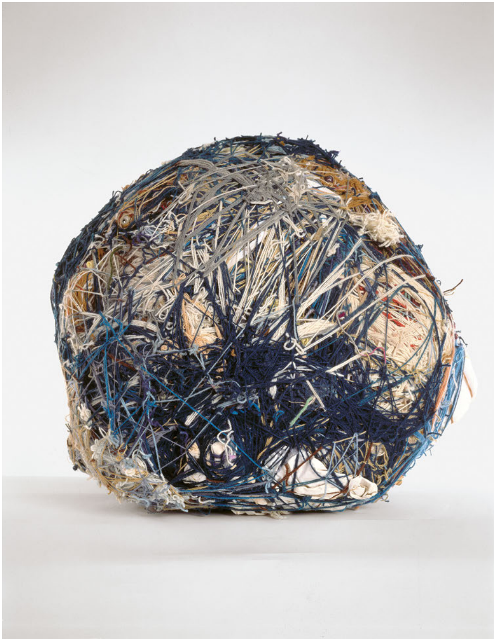
Judith Scott Ohne Titel (Ball), um 1998 Assemblage, Wollfäden, diverse Materialien, 94 x 73.7 x 83.8 cm Collection de l'Art Brut, Lausanne Foto: Leon Borensztein © Judith Scott, Creative Growth Art Center, Oakland, CA.

Eine Ausstellung der Bundeskunsthalle, Bonn, in Kooperation mit dem Forschungsprojekt TOUCHDOWN 21, im Zentrum Paul Klee, Bern